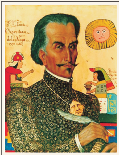
INCA GARCILASO DE LA VEGA (1539-1616)