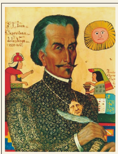
INCA GARCILASO DE LA VEGA (1539-1616)